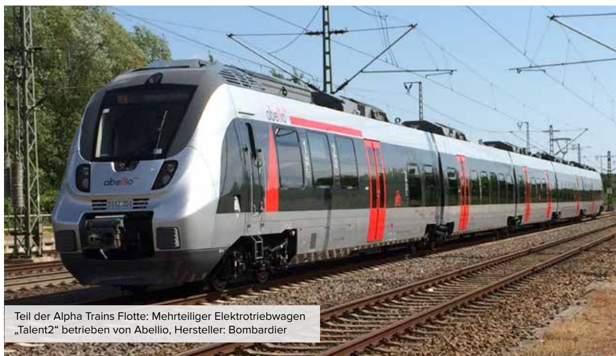
Teil der Alpha Trains Flotte: Mehrteiliger Elektrotriebwagen „Talent2“ betrieben von Abellio, Hersteller: Bombardier

Für die ‚grüne‘ Privatplatzierung hat Alpha Trains als weltweit erstes, privates Unternehmen der Bahnbranche die Climate Bond-Zertifizierung erhalten. Ein großer Erfolg, der die Finanzierungs-, Umwelt- und Sozialverantwortungsstrategie des Unternehmens untermauert - schließlich leistet Alpha Trains mit den hochmodernen und energieeffizienten Elektrotriebzügen einen wichtigen Beitrag zu den Klimaschutzzielen der